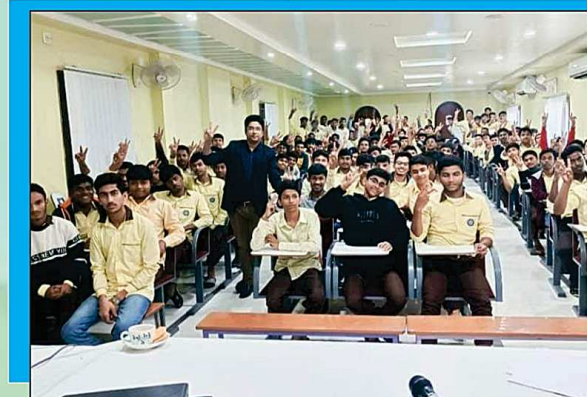
সেমিনার হলে ছাত্র-ছাত্রীদের নিয়ে মোটিভেশন ক্লাস ও কেব্রিয়ার গাইড এর পরামর্শ চলছে।