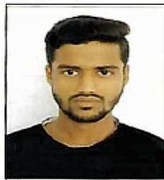
AZAHAR SK MARKS 560 AIR 40037