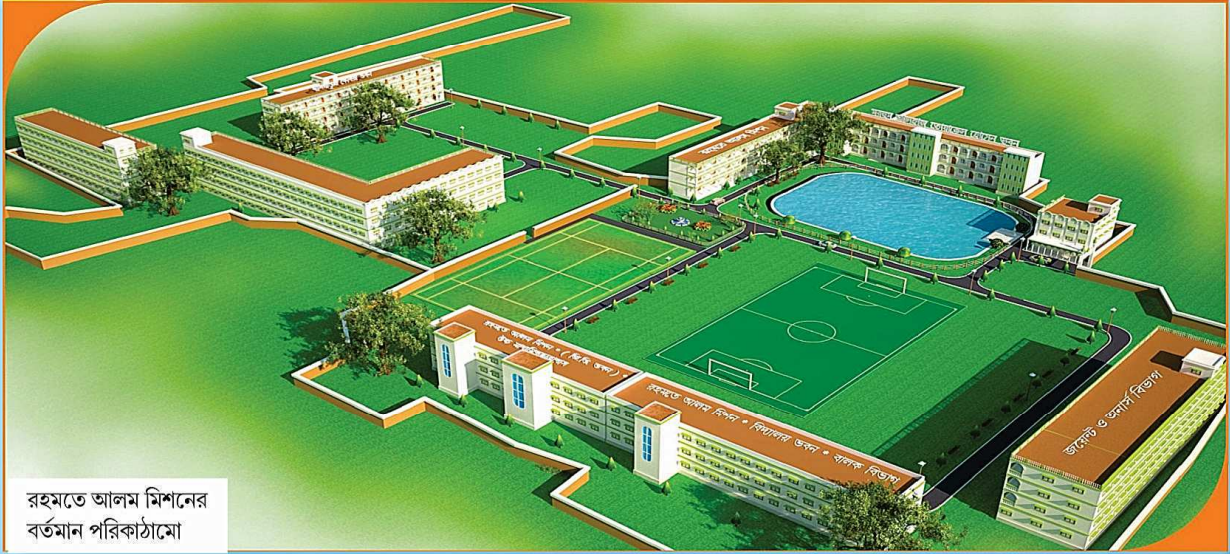
রহমতে আলম মিশনের বর্তমান পরিকাঠামো