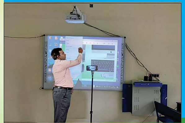
ছাত্র-ছাত্রীদের ডিজিটাল বোর্ডের মাধ্যমে পাঠদান করা হচ্ছে।