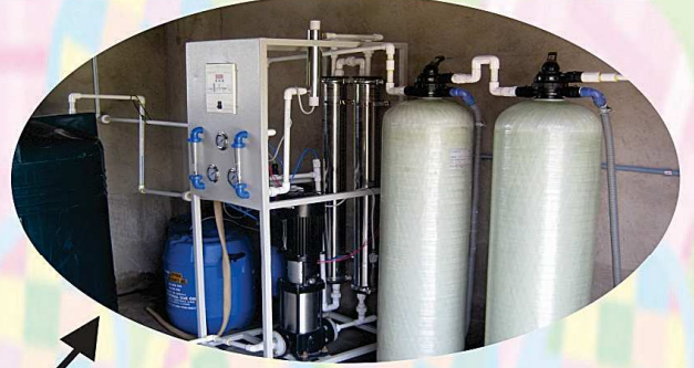
বিশুদ্ধ পানীয় জলের প্রকল্প