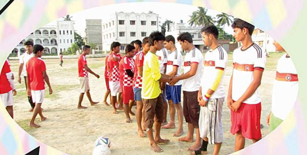
শরীর চর্চা ও খেলাধুলা