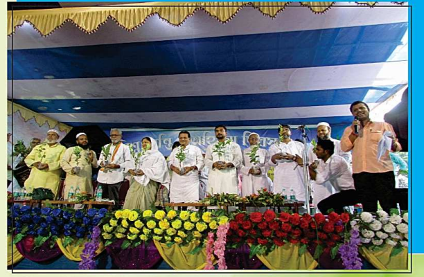
বিশ্বশান্তি ও অহিংসা দিবসের বার্তা দিতে মিশনে উপস্থিত বিশিষ্ট গুনিজনেরা.....