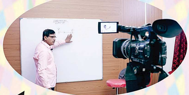
করোনা আবহে ভার্চুয়াল ক্লাসের মাধ্যমে শিক্ষাদান