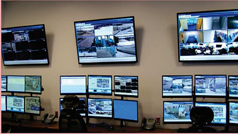
সি.সি. টি.ভির মাধ্যমে ক্যাম্পাস ও ক্লাস রুম মনিটরিং