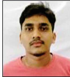
MOHABBAT H. MOLLIK MARKS 577 AIR 29845