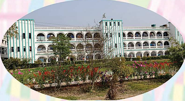
প্রাচীর ঘেরা সবুজ, শান্ত, স্নিগ্ধ ও নির্মল পরিবেশ